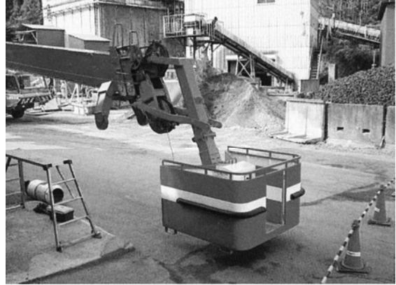
200T フルオートジブ取付

ボックスの外側は銅板で囲い、高所においての搭乗者の風よけと恐怖心を少なくしています